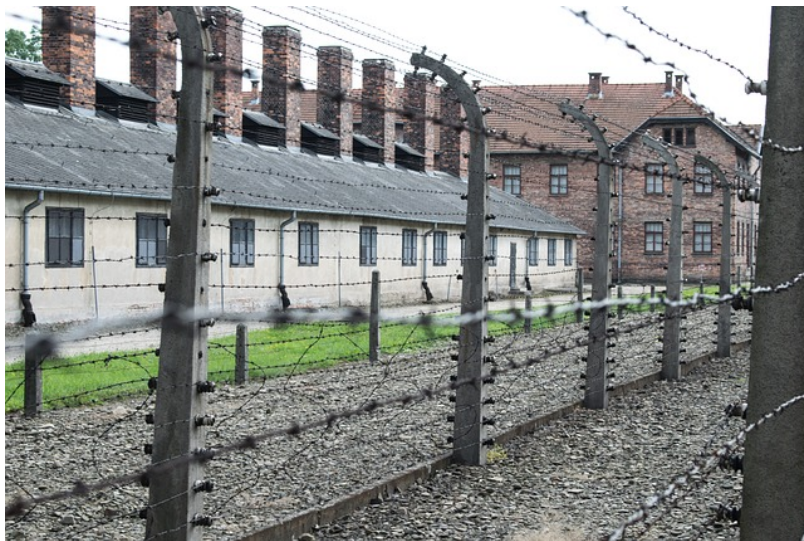
מחנה ההשמדה אושוויץ

ועכשיו לפולין. השבוע נחקק חוק חדש, האוסר על מתן אחריות לפולין על מה שנעשה בשטח שלה בזמן מלחמת העולם השנייה, על ידי הנאצים בתקופת הרייך השלישי. בירושלים כועסים מאוד על החוק, ומצפים מממשלת פולין לשנות אותו כמה שיותר מוקדם.