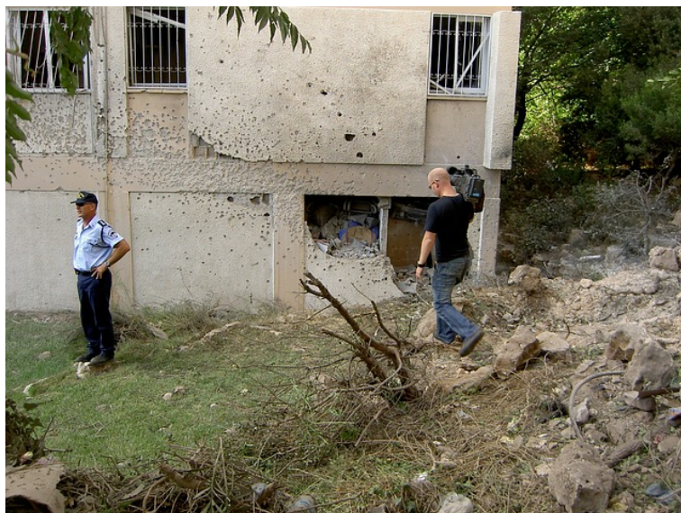
ישראל בזמן מלחמת לבנון השנייה

מתחילים עם גבול הצפון. היום (יום שלישי 30/01/2018) הרמטכ"ל, גדי אייזנקוט אמר כי ארגון החיזבאללה מתעצם, אבל צה"ל מוכן לכל מצב ועובד יום ולילה כדי להיות מוכן לכל תרחיש.