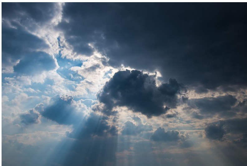
ביום שישי יהיה חם. ביום ראשון שוב גשם

ביום ראשון הטמפרטורות צפויות לרדת ושוב צפוי גשם בצפון הארץ ובמרכז הארץ.